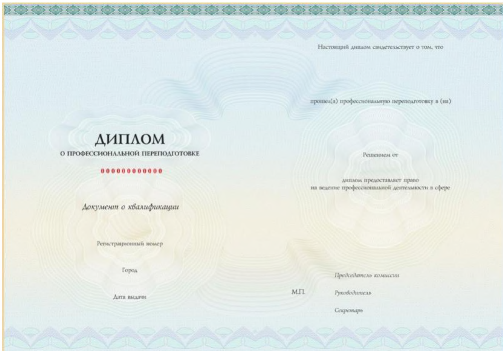
Образец диплома о профессиональной переподготовке, с приложением